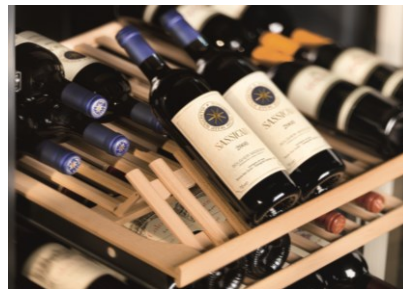
▲プレゼンテーション棚は、ボトルの貯蔵だけでなく、演出性としての機能も満たします。 可動棚の奥は、ボトルを水平に置くことが出来るようになっています