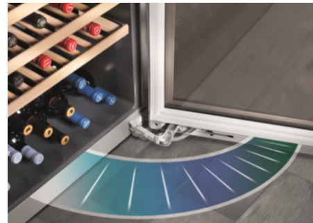
▲ドアヒンジに組み込まれている SoftSystem 機能は、 ドアの開閉角度が約45度のポジションで緩やかに閉まる動きを可能にします。

ドイツLIEBHERR社 Household Appliances 日本輸入総代理店