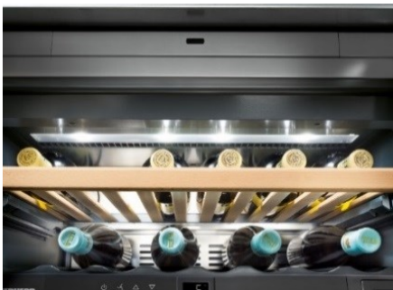
▲LEDライトは各ゾーンの上部に位置しており、庫内に均一な光を提供します。